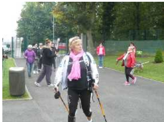
Echauffement avant le départ de la marche nordique