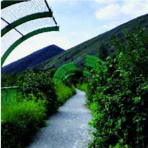
Découverte nature et patrimoine de la Chaîne des Terrils

Un grand merci à tous nos partenaires qui ont contribué au succès de cette action ! (la Ville De Lens, Opaline 62, l'Assurance maladie Artois, la CARMI Filiéris, le CLAD* Lens/Liévin/Hénin/Carvin, la Ligue contre le Cancer 62, la MGEN, La Mutualité française 59/62, la Bande à Blandine)