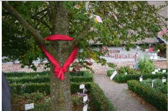
Prix du bâtiment public en rose : Musée de La Bataille à Noorpeene