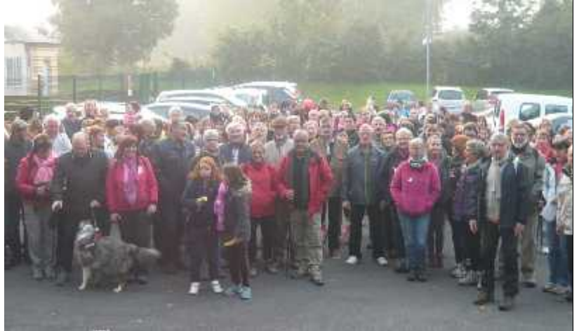
Photo de groupe avant le départ de la randonnée