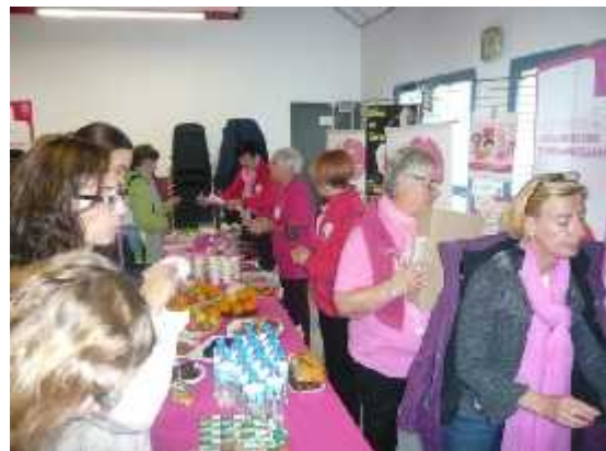
Toute l'équipe s'affaire !