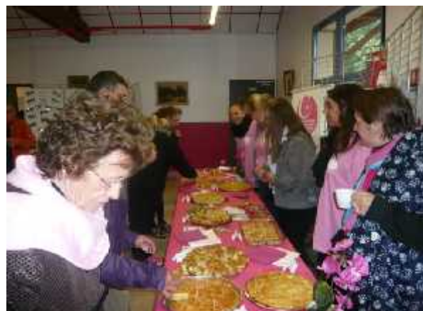
Un succulent buffet préparé par le club cuisine du Centre social Alexandre Dumas de Lens attendait le retour des participants